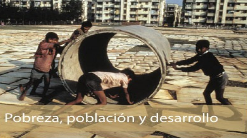
Pobreza, población y desarrollo